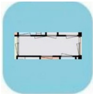
Entree en Hal