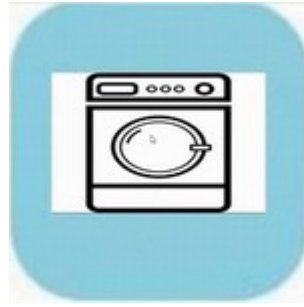
Wassen en drogen